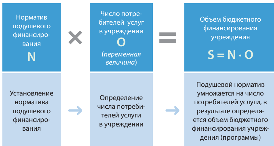
Рисунок 5. Механизм нормативного подушевого финансирования.

Здесь поется второй романс о финансах: стандарт финансируется по нормативному подушевому принципу, т.е. на каждого ученика школы государство в лице распорядителя бюджетных средств (учредителя) выделяет определенные деньги (рис.5).