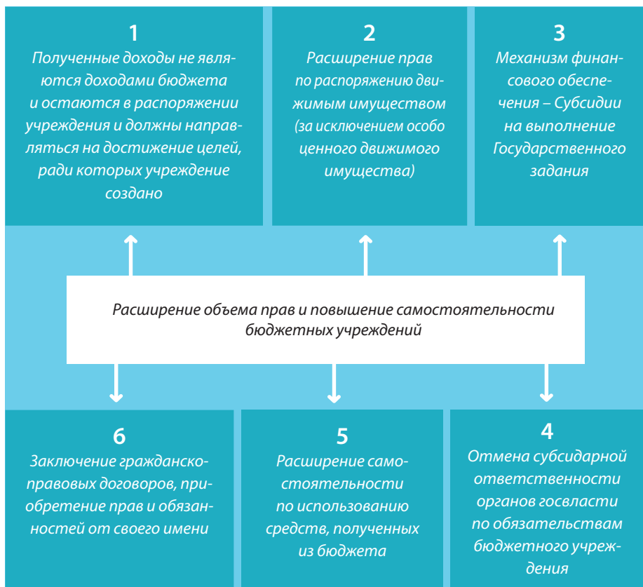
Рисунок 3. Основные изменения в статусе БУ

План деятельности по выполнению государственного задания и отчет директора об исполнении государственного задания – зона интереса Управляющего совета школы.