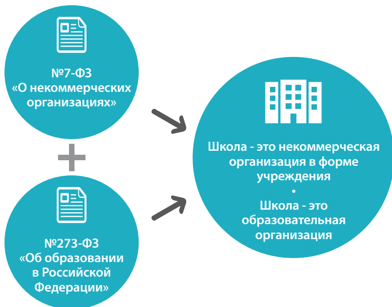
Рисунок 4. Двойная типология школ.

Справедливо будет подчеркнуть, что все базовые нормы экономической жизни школы прописаны в Федеральном законе №7-ФЗ «О некоммерческих организациях». И если мы хотим эти базовые нормы знать, стоит изучить статью 9.2 «Бюджетные учреждения» этого Закона 9 .