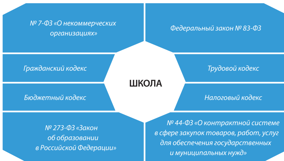
Рисунок 2. Основные ФЗ, влияющие на экономику школы.

На школу «работают», т.е. фундаментально влияют на ее экономическое самочувствие, восемь Федеральных законов (рис. 2).