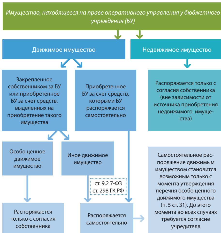
Рисунок 5. Расширение объема прав по использованию и распоряжению движимым имуществом бюджетного учреждения (школы).