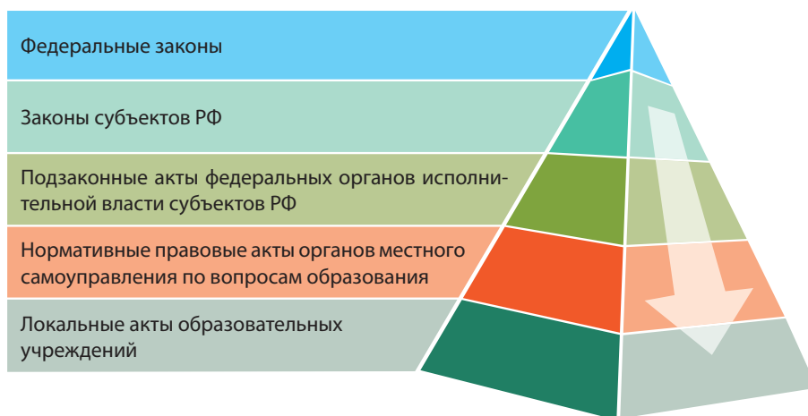
Рисунок 1. Иерархия отраслевого законодательства.

Каждая отрасль права имеет собственное законодательное «ядро» в виде нормативно-правовых актов. Юридическая сила этих актов определена своеобразной иерархией отраслевого законодательства (рис. 1). Для образования, как и любой другой отрасли экономики, выделяются: